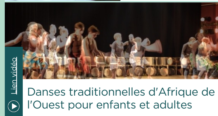
Danses traditionnelles d'Afrique de l'Ouest pour enfants et adultes