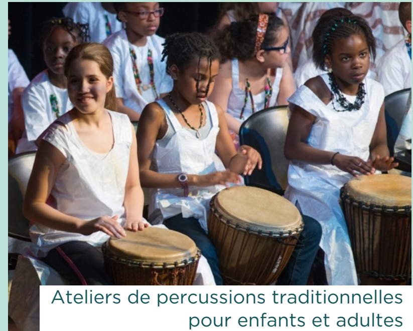
Ateliers de percussions traditionnelles pour enfants et adultes